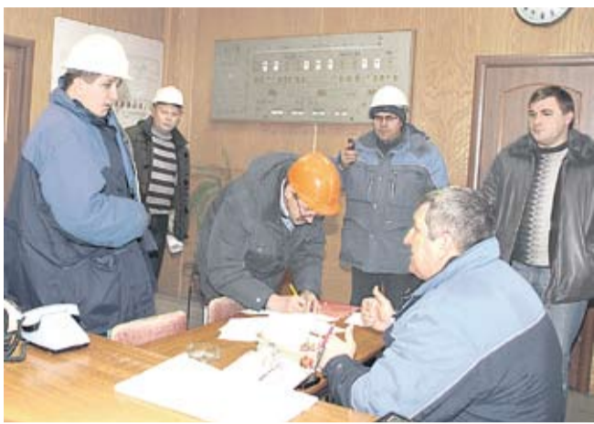
Подписание акта приёмки

В конце декабря 2011 года комиссия, в состав которой вошли главные специалисты предприятия, приняла в эксплуатацию систему автоматического пожаротушения, которая обеспечит защиту маслоподвала в корпусе дробления участка № 2 ДОФ.