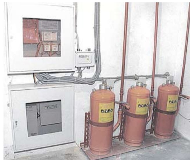
Блок управления системой пожаротушения