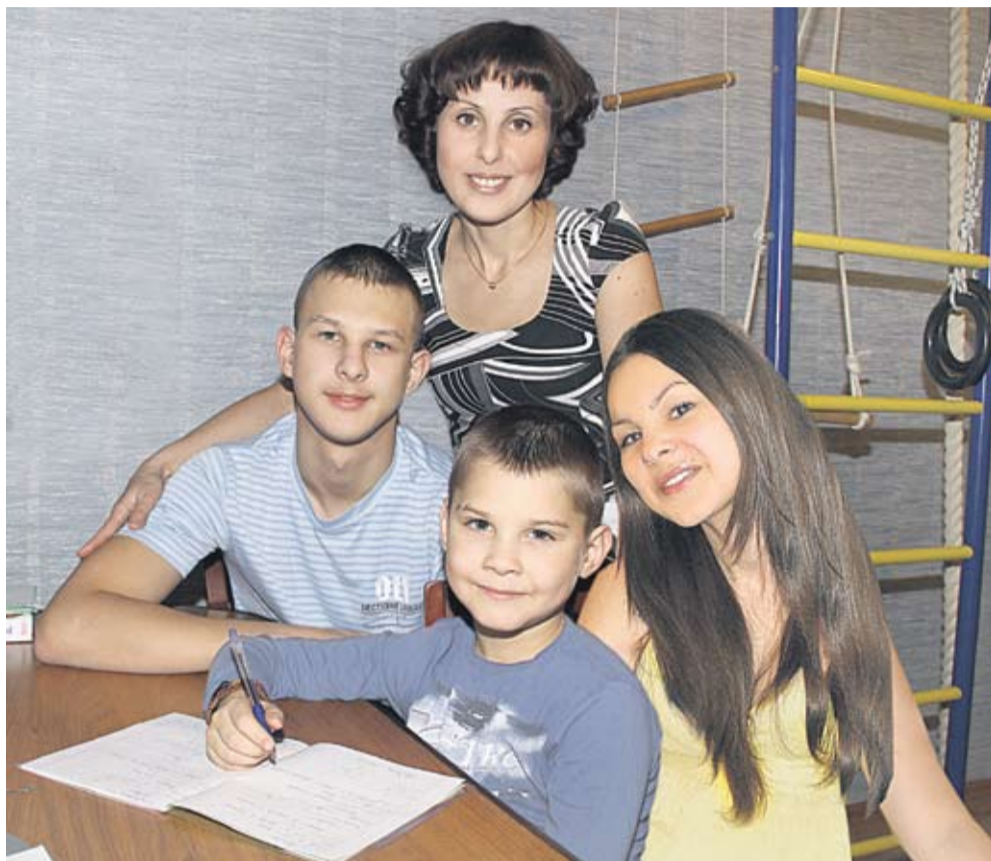
Два сыночка и лапочка дочка

27 ноября – один из самых душевных и замечательных праздников. Праздник добра, тепла и любви к нашим мамам.