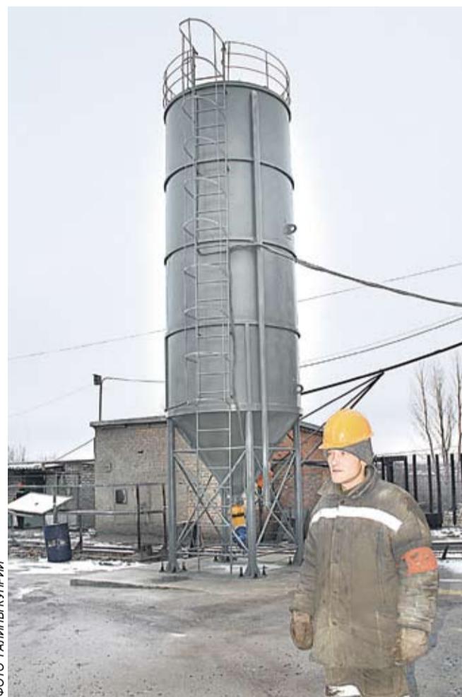
Бункер готов к работе

Кроме того, следует отметить и то, что трудозатраты с появлением бункера тоже уменьшились – ранее к таким работам привлекалось три человека, а теперь один, прошедший инструктаж и ознакомленный с паспортом организации работ.